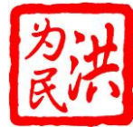
香港交通安全隊總監 洪為民教授, JP